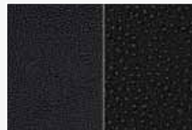
Tissu/Cuir noir cacao C