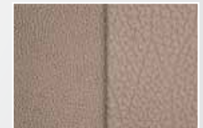
Cuir beige F

♦ Livrable sur le modèle 3.5L Sport seulement. La couleur intérieure dépend du choix de la couleur extérieure. En raison des différents procédés d'impression, les couleurs reproduites dans cette brochure peuvent varier légèrement de la teinte exacte. Consultez votre concessionnaire pour connaître les couleurs offertes selon le modèle et voir les échantillons de couleurs Hyundai. Pour en savoir plus, visitez hyundaicanada.com ou rendez-vous chez votre concessionnaire.