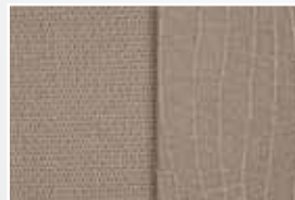
Tissu beige B