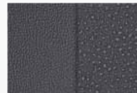
Tissu/Cuir gris D