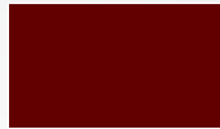
Rouge Sierra B C F