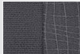
Tissu gris A