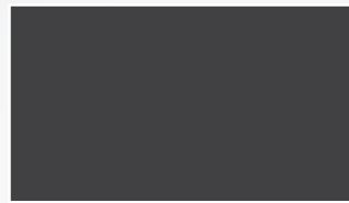
Argent pierre de lune A D E