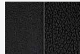
Cuir noir cacao E